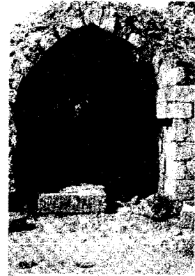
An arch in Tughlakabad, Delhi

The city of Dehli covers a wide area and has a large population ... The rampart round the city is without parallel. The breadth of its wall is eleven cubits; and inside it are houses for the night sentry and gatekeepers. Inside the ramparts, there are store-houses for storing edibles, magazines, ammunition, ballistas and siege machines. The grains that are stored (in these ramparts) can last for a long time, without rotting ... In the interior of the rampart, horseman as well as infantrymen move from one end of the city to another. The rampart is pierced through by windows which open on the side of the city, and it is through these windows that light enters inside. The lower part of the rampart is built of stone; the upper part of bricks. It has many towers close to one another. There are twenty eight gates in this city which are called darwaza, and of these, the Budaun darwaza is the greatest; inside the Mandwi darwaza there is