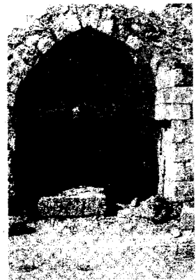
तुगलकाबाद, दिल्ली का एक मेहराब ।

दिल्ली बड़े क्षेत्र में फैला घनी जनसंख्या वाला शहर है.... शहर के चारों ओर बनी प्राचीर अतुलनीय है, दीवार की चौड़ाई ग्यारह हाथ (एक हाथ लगभग 20 इंच के बराबर) है; और इसके भीतर रात्रि के पहरेदार तथा द्वारपालों के कक्ष हैं । प्राचीरों के अंदर खाद्यसामग्री, हथियार, बारूद, प्रक्षेपास्त्र तथा घेरेबंदी में काम आने वाली मशीनों के संग्रह के लिए भंडारगृह बने हुए थे.... प्राचीर के भीतरी भाग में घुड़सवार तथा पैदल सैनिक शहर के एक से दूसरे छोर तक आते-जाते हैं । प्राचीर में खिड़कियाँ बनी हैं जो शहर की ओर खुलती हैं और इन्हीं खिड़कियों के माध्यम से प्रकाश अंदर आता है । प्राचीर का निचला भाग पत्थर से बना है जबकि ऊपरी भाग ईंटों से । इसमें एक दूसरे के पास-पास बनी कई मीनारें हैं । इस शहर के अट्टाईस द्वार हैं जिन्हें दरवाज़ा कहा जाता है, और इनमें से बदायूँ दरवाज़ा सबसे विशाल है; मांडवी दरवाज़े के भीतर