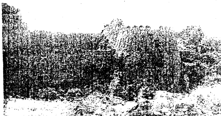
Fig: Part of the fortification wall of the settlement

market; adjacent to the Gul Darwaza there is an orchard ..... It (the city of Dehli) has a fine cemetery in which graves have domes over them, and those that do not have a dome, have an arch, for sure. In the cemetery they sow flowers such as tuberose, jasmine, wild rose, etc.; and flowers blossom there in all seasons.